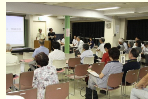
8月18日の中間報告会の様子

中間報告会の開催を通じて、地域の皆様と検討会がまちへの思いを共有することができ、とても有意義な機会になったと実感しています。ありがとうございました。