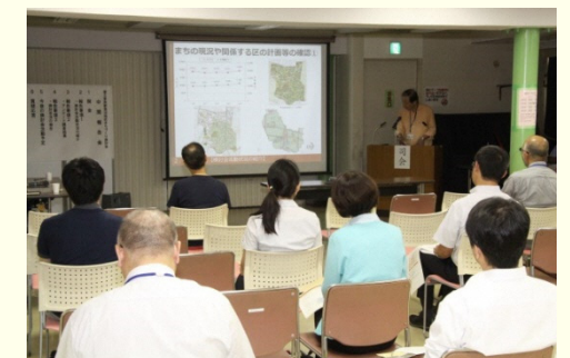
8月19日の中間報告会の様子